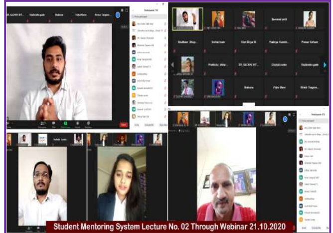
Student Mentoring System Lecture No. 02 Through Webinar 21.10.2020