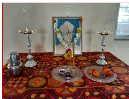
Virtual celebration of Teacher's day