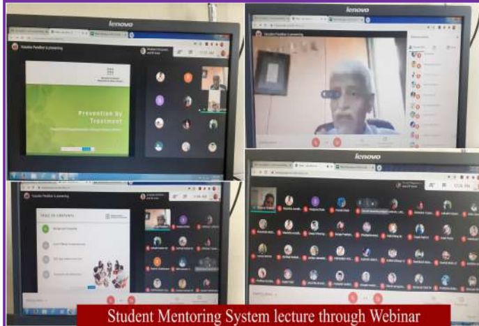
Student Mentoring System lecture through Webinar